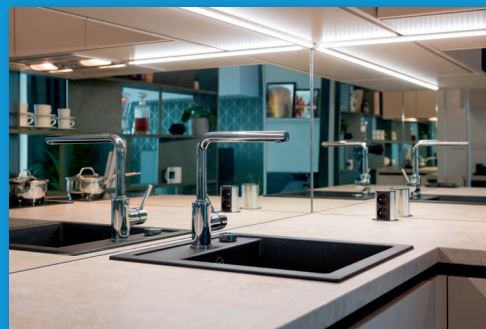
crédences de cuisine →