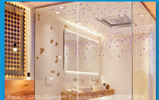
Espacio GIRA, Guillermo Escobedo - CASA DECOR 2016

Eclairage plus intense dans la salle de bain que dans la chambre →