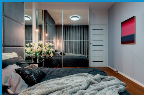
← portes de placard

C'est le meilleur choix pour les crédences et meubles de cuisine ainsi que les applications de miroirs trempés.